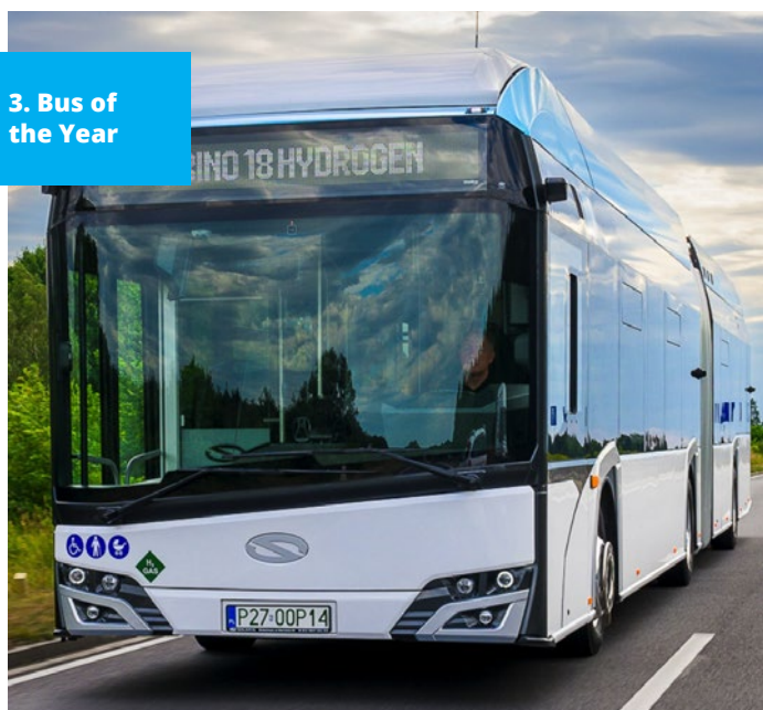
3. Bus of the Year