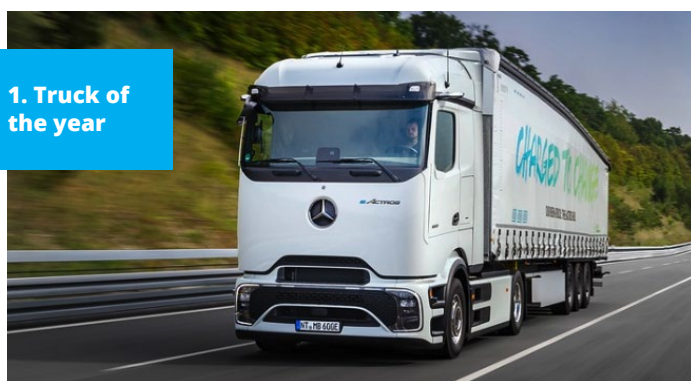
1. Truck of the year

Die diesjährigen Preisträger repräsentieren zutreffend die zu