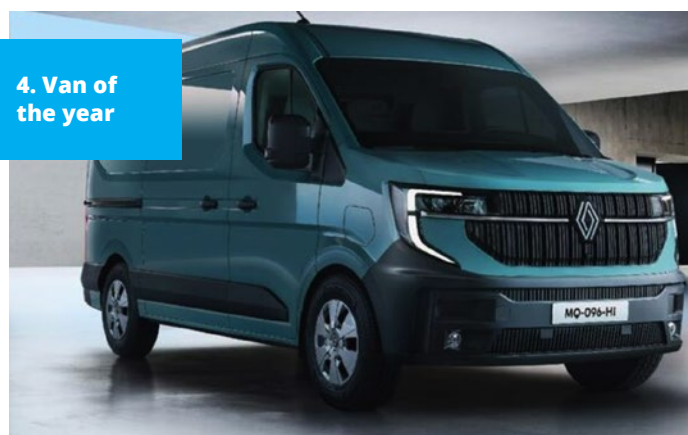
4. Van of the year