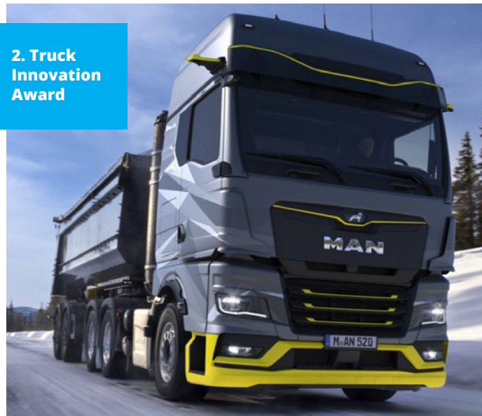
2. Truck Innovation Award